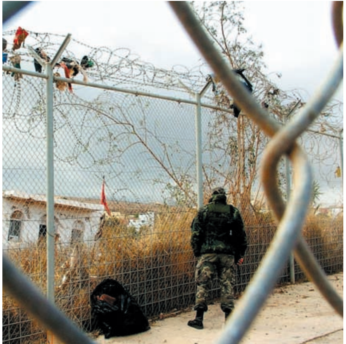
LA VALLA DE LA VERGÜENZA. La militarización de la frontera ha sido la reacción de la UE frente a la presión migratoria.

La Unión Europea lleva tiempo dominada por dos obsesiones: la defensa acérrima de la libre circulación de mercancías, capitales y servicios y la apuesta por políticas monetaristas que erradiquen la inflación y el déficit. Esas obsesiones, por miedo o por convicción, han sido asumidas por la mayoría de los Estados miembros, sobre todo en la eurozona. En ese contexto, sólo cabe concluir que el modelo económico impulsado por la UE es una amenaza en toda regla a los derechos sociales en el interior de los Estados y un obstáculo para el surgimiento de políticas sociales y ambientales robustas a escala europea.