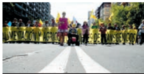
ZARAGOZA, ABRIL 2009. Manifestación contra los transgénicos.

El encuentro estatal "Activ@s contra la crisis" convoca una jornada de lucha y movilización, impulsando, entre otras acciones, marchas contra el paro, la crisis y el racismo, desde diferentes puntos de la península rumo a Madrid.