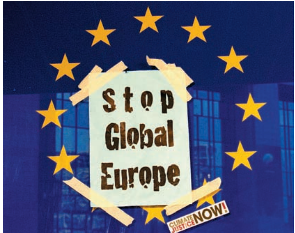
JUSTICIA CLIMÁTICA. La Presidencia española se enmarca en plena crisis económica, energética y climática.

La gran medida contra la crisis consiste en la puesta en marcha de organismos para regular los mercados financieros, aunque carece todavía de concreción y no parece que esté diseñada más que para contro-