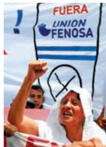
NICARAGUA, 2006. Protesta contra Unión Fenosa en Managua.

En la década de los 90, a raíz de la creación del Mercado Único Europeo y la consolidación del marco económico neoliberal (Consenso de Washington), se produce un proceso de apertura e