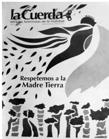
Revista La Cuerda

Concebem la publicació feminista La Cuerda com un mitjà de caràcter massiu i enfocament alternatiu que transmet informació, opinions i sabers