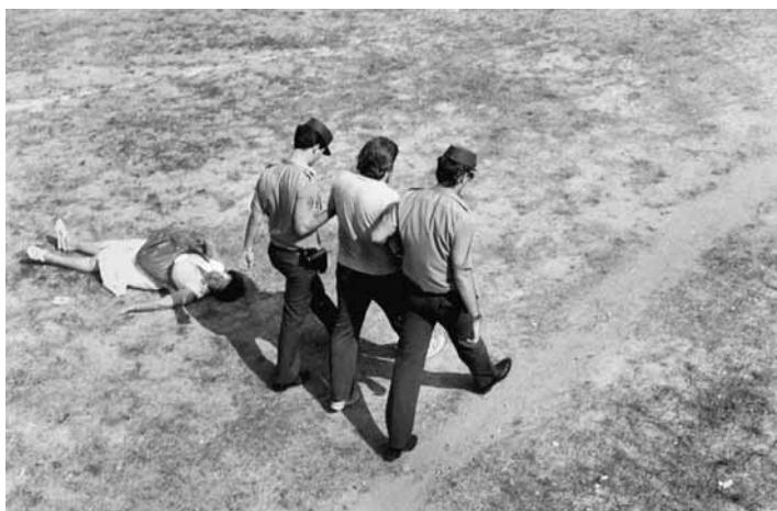
Desallotjament d'una fàbrica a Parets del Vallès (agost, 1986)

Però hem de recordar que l'any 1976 un treballador acomiadat de manera "improcedent" tenia dret a triar entre quedar-se a l'empresa o una indemnització de 60 dies per any treballat, amb un límit de 5