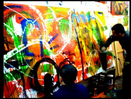
Pintura en grupo para colectiva.