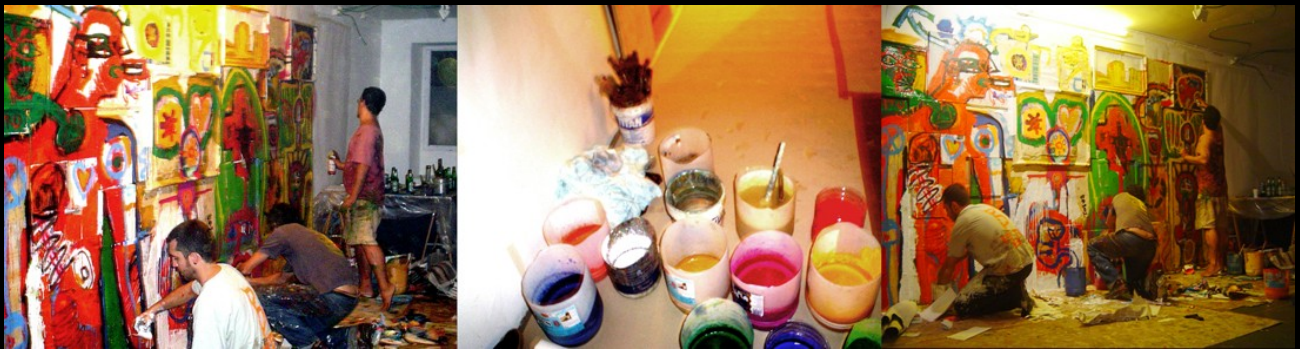
Jam session Miscelánea.