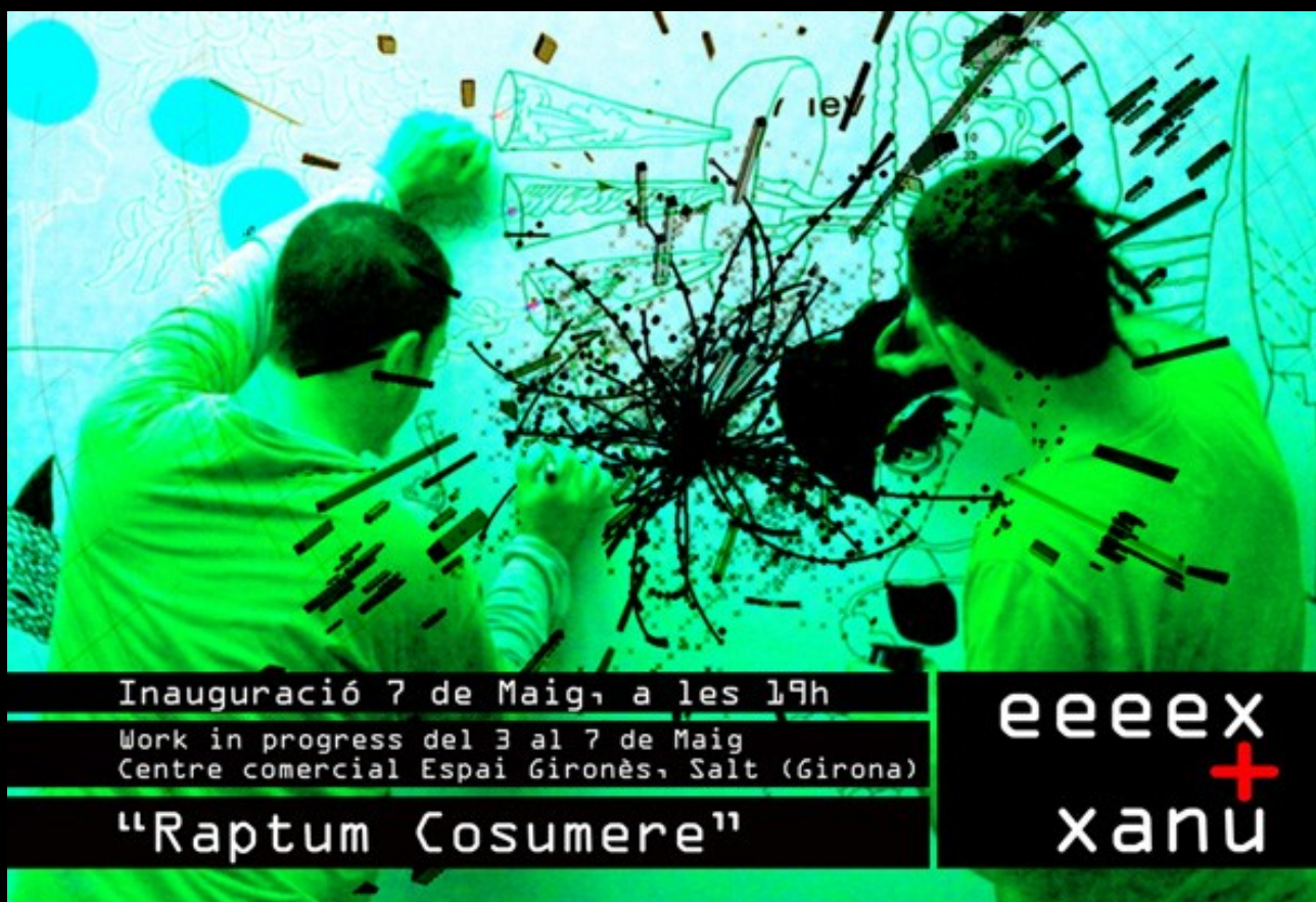
Flyer de “Raptum Cosumere”. Work in progress. Mayo 2010.

Durante los días que dure la exposición, al lado de cada cuadro se colgará una serie de fotos del proceso desde el inicio hasta el final y en una de las paredes, la proyección en loop de toda la acción.