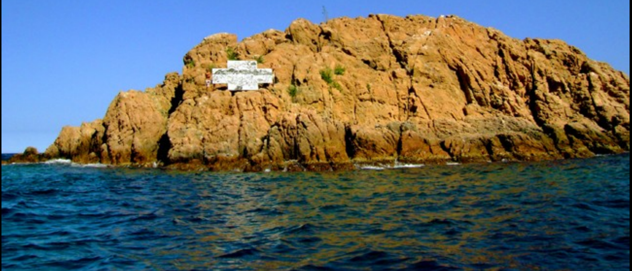
“Garbí magnetofluídodinàmic”. Action painting en una isla desierta.

Action Painting in Tossa de Mar August 09