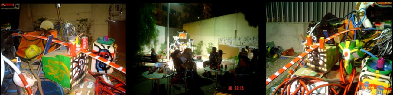
"Indigestión TV". Instalación.