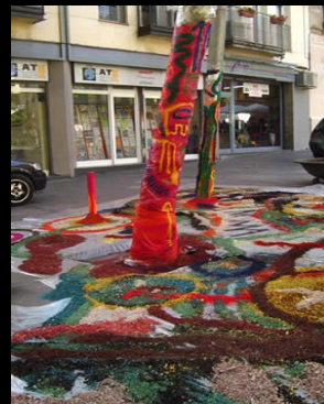
Intervención en espacio público ( plz. Diamant ) : Mandala urbano.