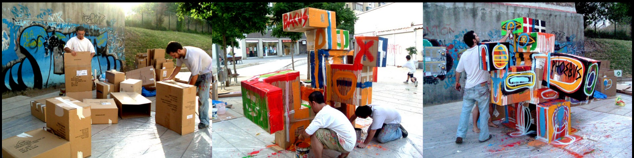
Escultura en Can Basté. Festival Turoleando.