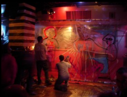
Jam session Moshiba Club.