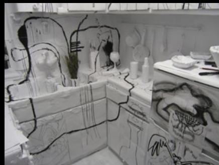
“El sueño psicopático de una farigola tetradimensional”