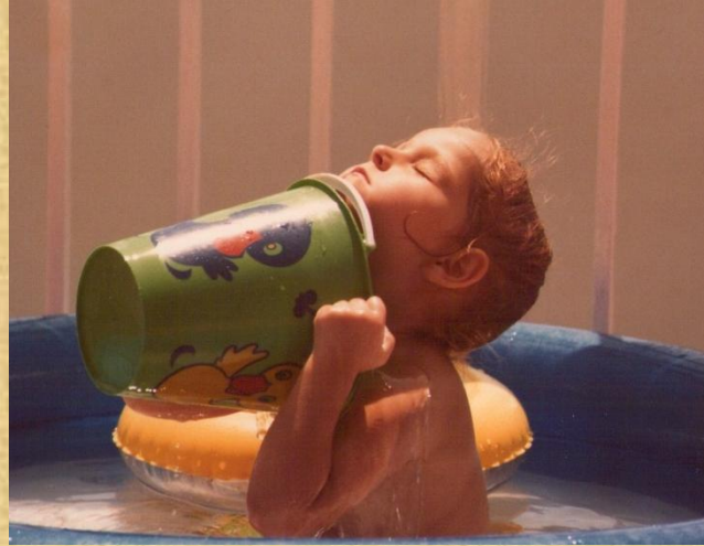
La presència és l'estat natural dels infants

En aquesta ocasió viurem diferents dinàmiques que ens permetran endinsar-nos en l'experiència d'estar presents, de prendre consciència de la nostra presència mentre acompanyem. Així podrem explorar com i des d'on ens situem quan ens relacionem amb els infants i veure les diferències internes i externes que això comporta.