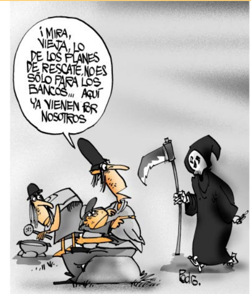
Ilustración tomada de www.rebellion.org

El 2 de abril se reúne en Londres el G-20. Las principales economías mundiales, responsables de la crisis planetaria, materializada en hambre, destrucción medioambiental y guerra, buscan definir una hoja de ruta para salvar un sistema insostenible. Entretanto, la semana de esa cumbre, en diferentes lugares del globo, otra humanidad responde.