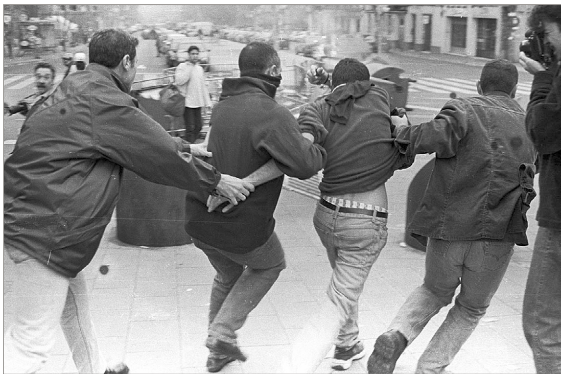
Policies de paisà detenen un manifestant el 12 d'octubre de 1999. MIREIA COMAS

El 12 d'octubre del 1999 feia 17 anys que grups ultradretans es concentraven a Barcelona per celebrar l'homenatge a la bandera i el dia de la hispanitat i la raça.