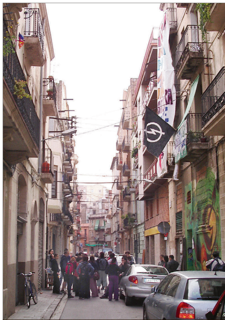
Primer intent de desallotjament de La Quinkalla, el 26 d'abril de 2004.

«Ens declarem insumbises a les penes multa, i ens enfrontem a un possible ingrés a presó en qualsevol moment»