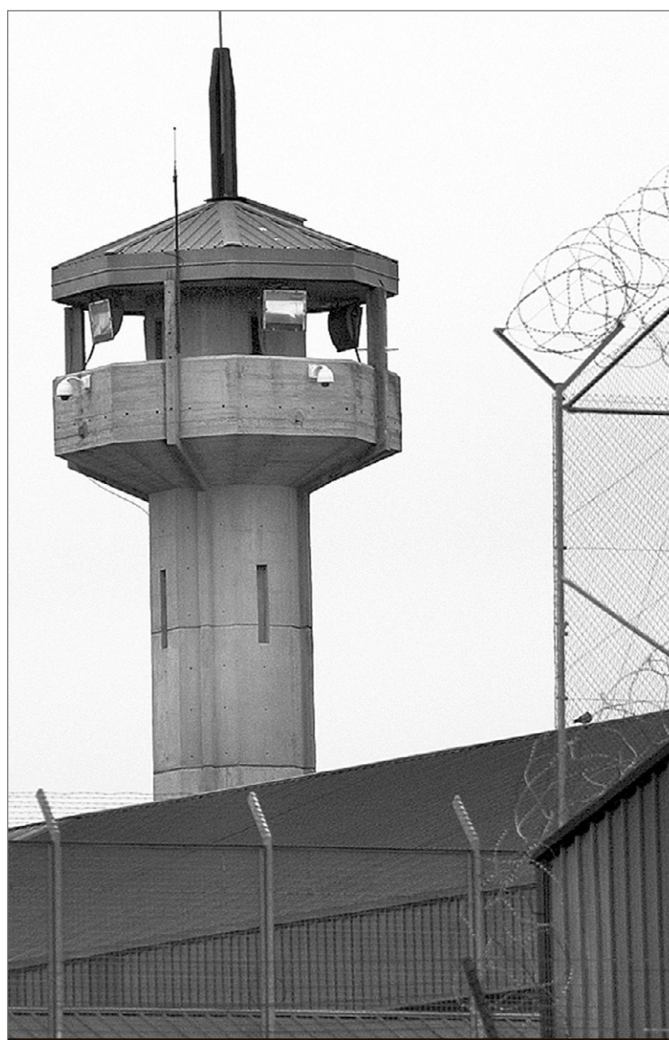
Torre de vigilància d'un centre penitenciari. DAVID DATZIRA

La denominada pena multa és una sanció penal de llarguíssima existència, els antecedents més remots de la qual es poden trobar en el dret babilònic, en el grec clàssic i en el dret romà posterior. Així mateix, sota la denominació de composició econòmica va arribar fins a l'època medieval i va penetrar fins i tot a Las Partidas .