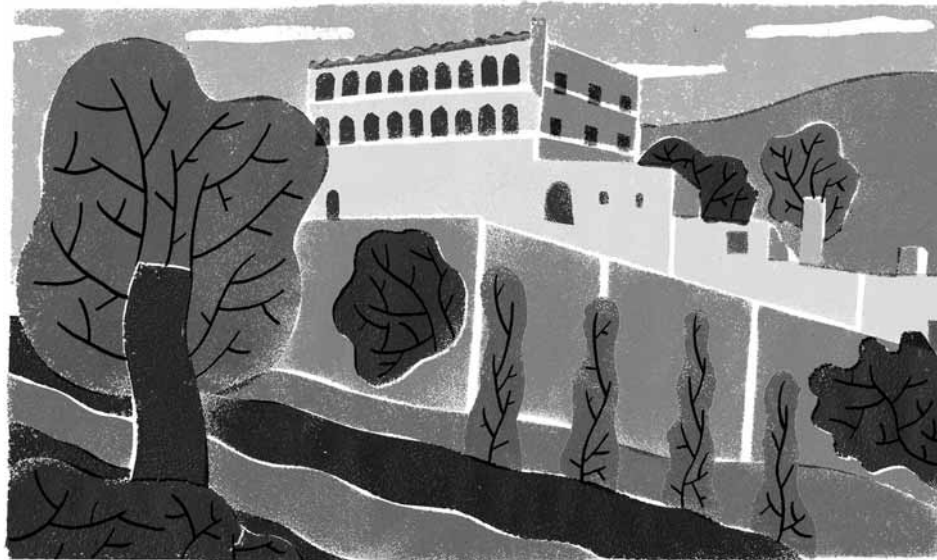
IL·LUSTRACIÓ: Chema Peral

Mentrestant, el procés judicial anava avançant. Dos anys després de guanyar el judici penal, el 2005, es va fer front al judici civil per mitjà de la campanya Donem-li la Volta!, que pretenia tornar la pilota a les propietàries i acusar-les d'abandonar la finca durant dècades. La demanda contra Sant Pau no va prosperar i el judici civil es va perdre, però la campanya va servir per concentrar suports al voltant del projecte, que, mentrestant, anava prenent cada vegada més força. La campanya contra el judici civil, però, va marcar un punt d'inflexió, a partir del qual es pot afirmar que el projecte inicia una segona etapa: la prioritat deixa de ser la projecció pública i la implicació en les lluites de la ciutat –tasques que, tot i que no s'abandonen, sí que perden pes relatiu– i se centra en el treball amb el barri i a consolidar els projectes que es desenvolupen a la vall. D'alguna manera, aquest canvi d'etapa és fruit d'una reflexió i d'una aposta que, amb els anys, anirà prenent força i fent-se més explícita: la voluntat de crear comunitat i d'aprendre a viure la resistència i la