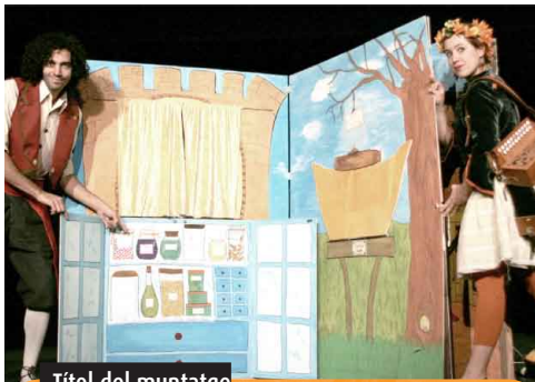
Títol del muntatge