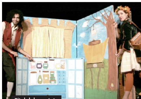
Títol del muntatge